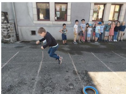
Les 5 bonds