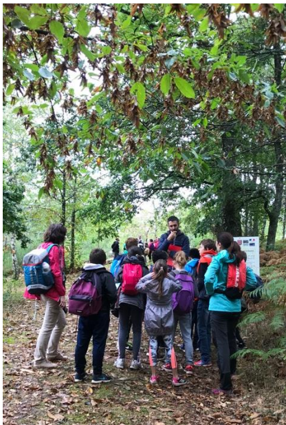
On marche pour rejoindre Paris ou Tokyo.