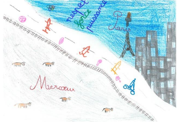
Jeux Olympiques 2024