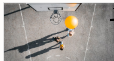
30' d'activité physique quotidienne Un dispositif pour promouvoir la pratique de 30 minutes d'activité physique quotidienne à l'école.

30 minutes d'activité physique quotidienne